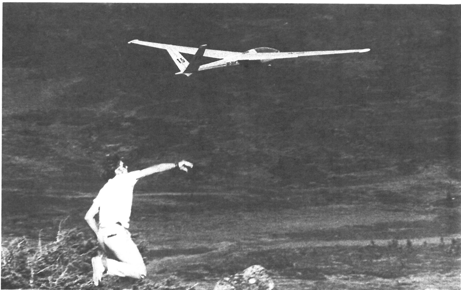
A 15 i Sälenfjällen.